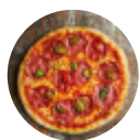
Pizza de Carne