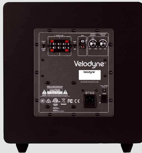
Velodyne impact mk 2

NEU: Velodyne impact mk 2 Subwoofer für HiFi und Heimkino in zwei Größen (10 oder 12 Zoll) ab 599* Euro.