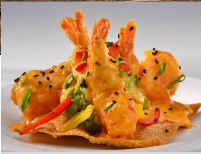
TOSTADA DE CAMARÓN TEMPURA