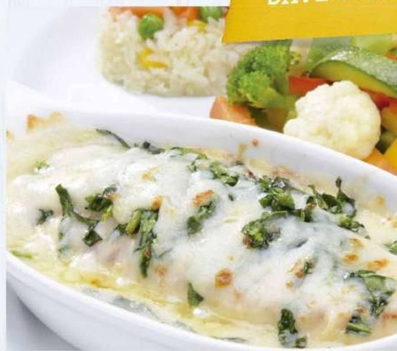
FILETE DOÑA OLIVIA