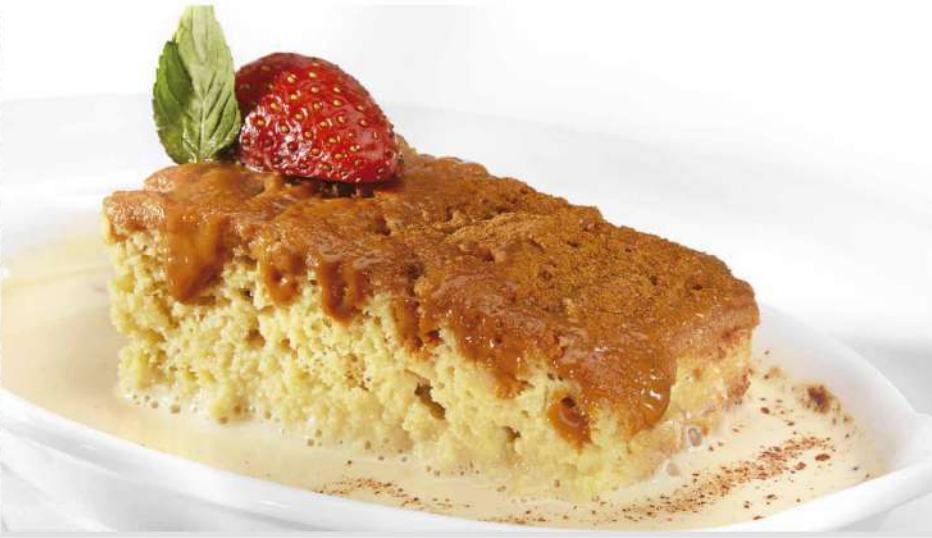
PASTEL DE TRES LECHEs