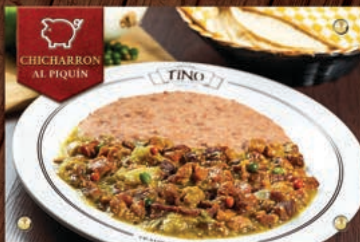
CHICHARRÓN AL PIQUÍN