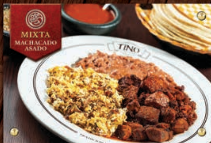
MIXTA MACHACADO ASADO