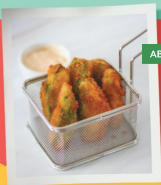
ABACATE NA PANKO

Mix de folhas, quinoa, ceviche havaiano (Saint Peter marinado no limão com sal rosa), molho ponzu, abacate, tomate cereja, sunomono, chips de batata doce, castanha de caju. Acompanha cebola roxa, cebolinha e pimenta biquinho.