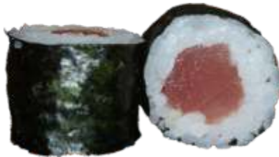
22. Tun 42 kr.