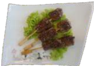
13. Oksekød spyd 50 kr.