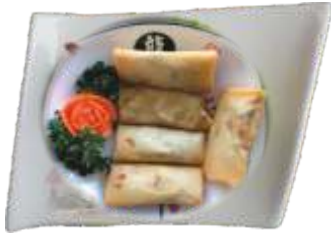
10. Vegetar Forårsruller 40 kr.