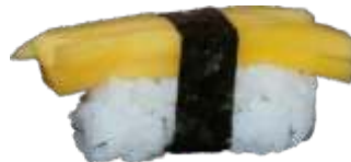
77. Mango 18 KR./34 KR.