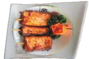
20A. Spicy Laks 50 kr.