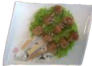
16. Kylling kødboller 45 kr.