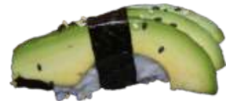
78. Avocado 18 KR./34 KR.