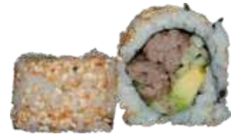
40. And Roll 80 kr. And, avocado, agurk og chilimayo Toppet med chilisesam