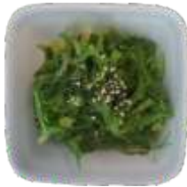
3. Tangsalat 42 kr.