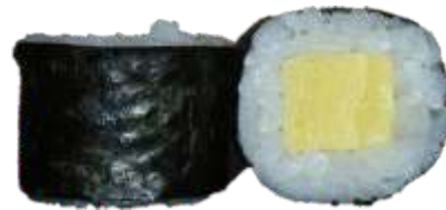
26. Omelet 36 kr.