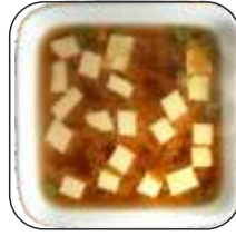
5. Misosuppe 36 kr.