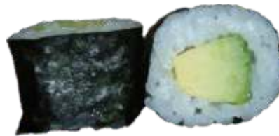
25. Avocado 36 kr.