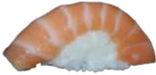
70. Laks 20 KR./38 KR.