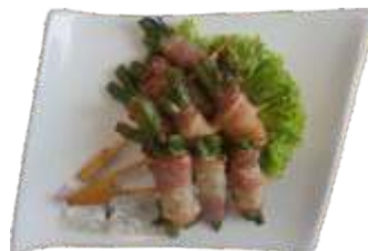
17. Asparges i bacon 50 kr.