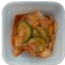
4. Kimchee 36 kr.