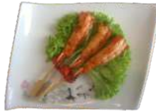
14. Kongerejer spyd 50 kr.