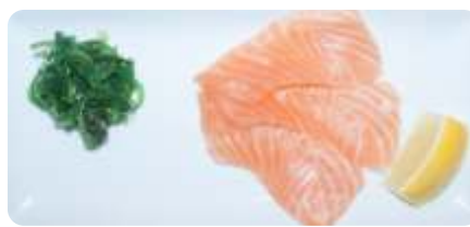
8. Laks i skiver 50 kr. (5 stk.)