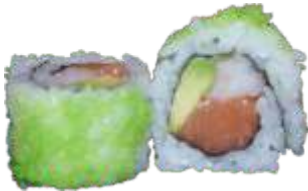
32. Grøn Mix 80 kr. Laks, rejer, avocado og chilimayo Toppet med masago wasabi