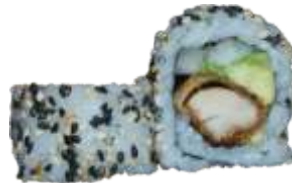
38. Crispy Kylling 78 kr. Crispy kylling, avocado, agurk og chilimayo. Toppet med sesam