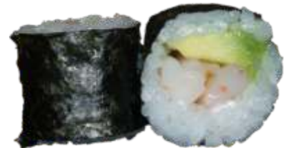
30. Rejer m. avocado 45 kr.