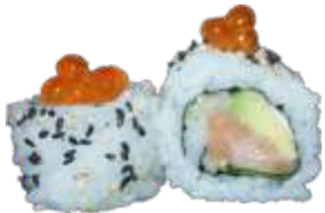
34. San Francisco 80 kr. Laks, flødeost, avocado, agurk og basilikum. Toppet med sesam og lakserogn.