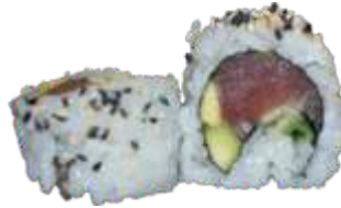
35. Tun Roll 80 kr. Tun, avocado, agurk og chilimayo. Toppet med sesam