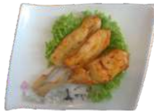
15. Kylling spyd 45 kr.