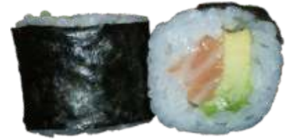
28. Laks m. avocado 45 kr.