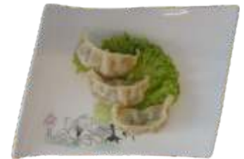
20. Dumplings 50 kr.