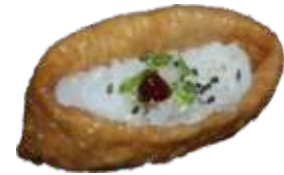
75. Inari 20 KR./38 KR.