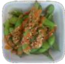
2. Spicy Edamame 36 kr.