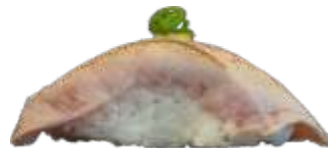
80. Flamberet Tun 25KR./45 KR.