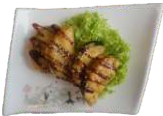
11. Aubergine 40 kr.