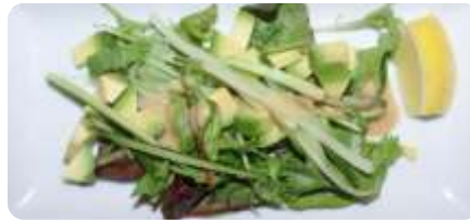
6. Grøn Salat 36 kr.