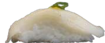
81. Flamberet Hellefisk 22KR./40 KR.