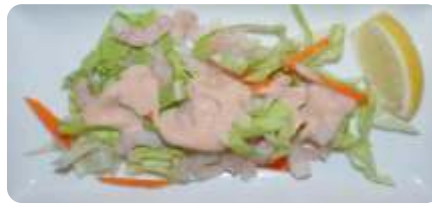
7. Rejecocktail 36 kr.