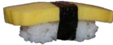
74. Omelet 18 KR./34 KR.