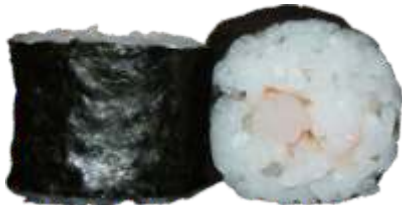
23. Rejer 42 kr.