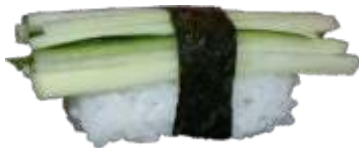
76. Agurk 18 KR./34 KR.