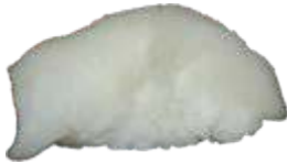
73. Hellefisk 20 KR./38 KR.