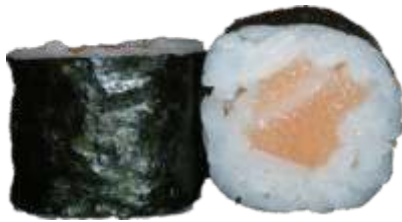
21. Laks 42 kr.