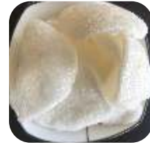
9. Rejer Chips 10 kr.