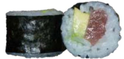
29. Tun m. avocado 45 kr.