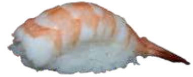
72. Reje 20 KR./38 KR.