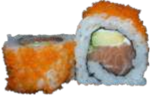
31. Pink Roll 78 kr. Laks, avocado og flødeost. Toppet med masago orange