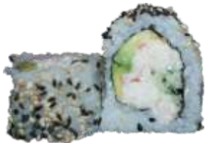
33. California 78 kr. Surimi i mayo, avocado og agurk Toppet med sesam