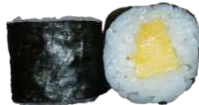
27. Mango 36 kr.