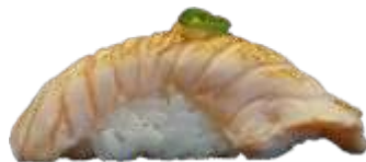
79. Flamberet Laks 22KR./40 KR.