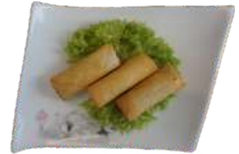
18. Forårsruller 50 kr.