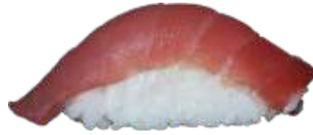
71. Tun 25 KR./45 KR.