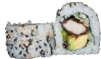
41. Sweet Pork Roll 78 kr. Hjemmelavet sødt svinekød, avocado, agurk og chilimayo Toppet med sesam.