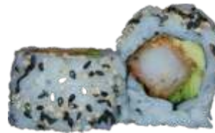
37. Crispy Rejer 78 kr. Crispy rejer, avocado og chilimayo. Toppet med sesam