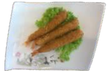
19. Crispy rejer 50 kr.