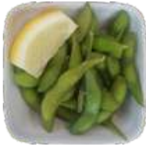
1. Edamame 32 kr.