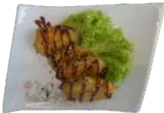
12. Squash 40 kr.