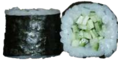
24. Agurk 35 kr. 36 kr.