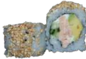
36. Grillet Salmon 78 kr. Flamberet laks, flødeost, avocado og agurk. Toppet med chilisesam