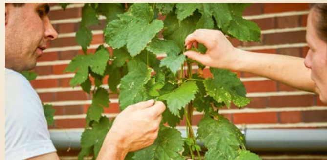
Echte Handarbeit: Pflege des Hopfengartens

Kein Wunder, denn ab Herbst gibt es, nur für kurze Zeit, eine unserer ganz besonderen Bierspezialitäten: den BELLHEIMER HOPFENGARTEN. Seit seiner Einführung lassen wir Bellheimer eine Tradition und somit ein Stück Brauereigeschichte jedes Jahr aufs Neue lebendig werden. Früher, in alter Zeit, kultivierte jede Brauerei ihren Hopfen