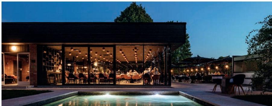
Vaade Tallinna lahele / päikeseloojangud Tallinn Bay view / Sunsets